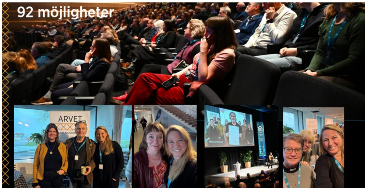
Arvets alla deltagare var medbjudna till evenemanget 92 möjligheter, där vi hade en monter samt berättade om ARVET på stora scenen.

Uppsala universitet följer hela projektet med forskarögon, för att förstå vad som faktiskt händer på platserna och se till att lärdomarna tas tillvara och kan spridas vidare. Målet vid projektslut är minst fyra genomförda innovationspiloter, minst 35 aktörer som stärkt sin digitala kompetens och en dokumenterad modell för hur man kan jobba med platsbaserad innovation inom kulturarv och besöksnäring, en modell som andra platser och regioner ska kunna använda.